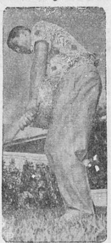
Ay Rosén, tercera base de los Indios de Cleveland y Rey de los Jontromeros de la Liga Americana, aparece aquí jugando al golf cerca de su casa en Miami, Florida.