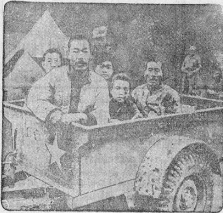
Un niño, usado por los norcoreanos para transportar municiones, aparece aquí con otros prisioneros rojos tomados por las fuerzas de las Naciones Unidas en su ofensiva hacia la frontera de la Manchuria.