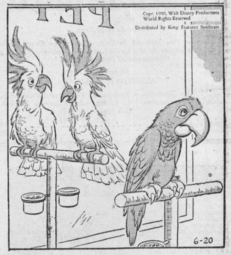
—Se casó muy joven y, naturalmente, nunca aprendió a hablar!